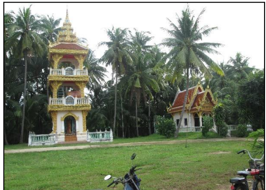
(วัดสุภรัตนาราม เมื่อปี พ.ศ.2560)