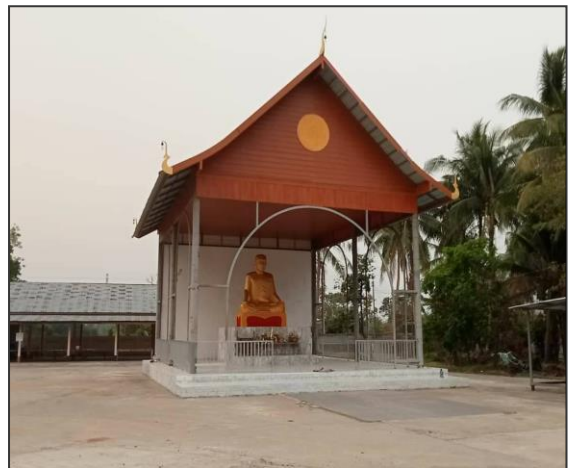
(วัดสุภรัตนาราม เมื่อปี พ.ศ.2567)