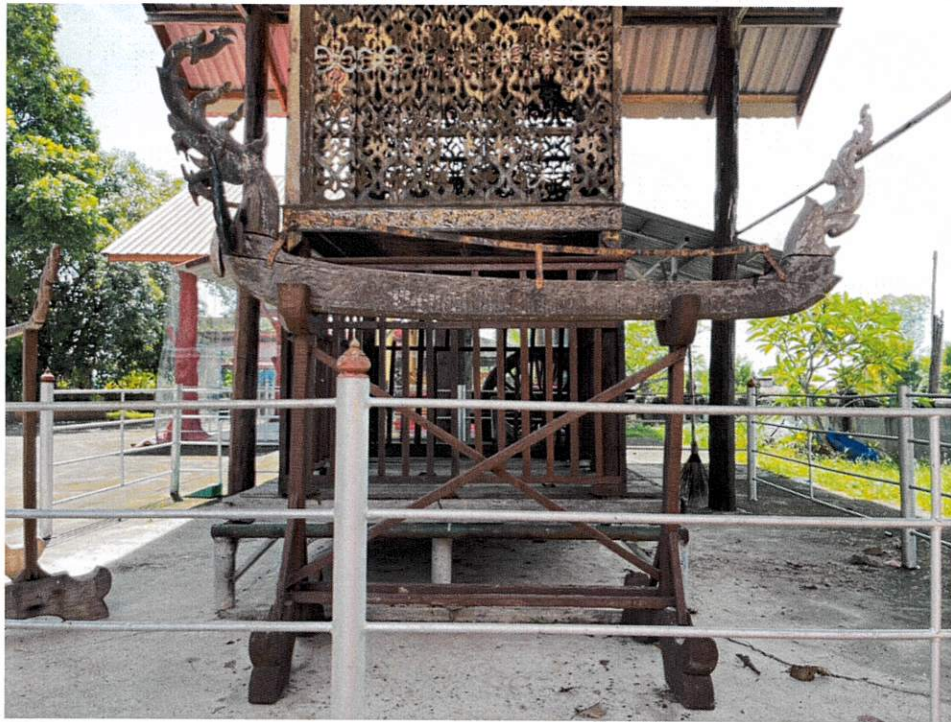
รางสร่งน้ำพระ (ฮางฮุด)