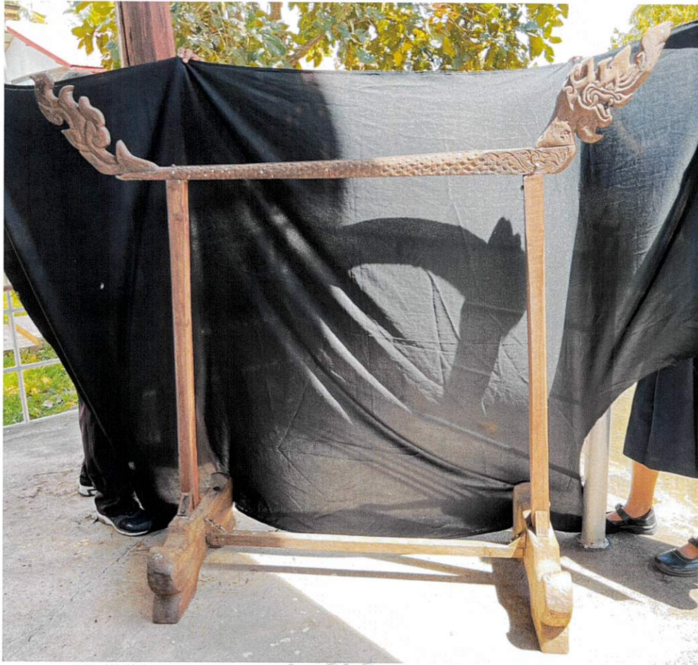
เชิงเทียน (ฮาวใต้เทียน)