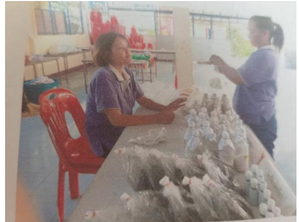
การผลิตเชื้อราไตรโคเดอร์มา เชื้อราบีวเวอร์เรีย ไวรัสแทนการใช้สารเคมี