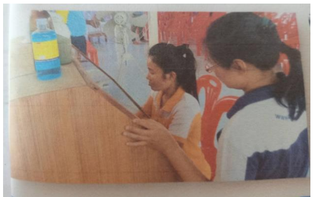
การผลิตและขยายสารชีวภัณฑ์ป้องกันกำจัดศัตรูพืช