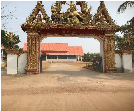
วัดท่าหลวง