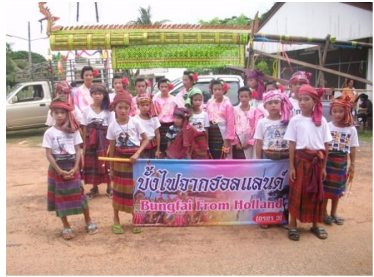
บุญบั้งไฟ