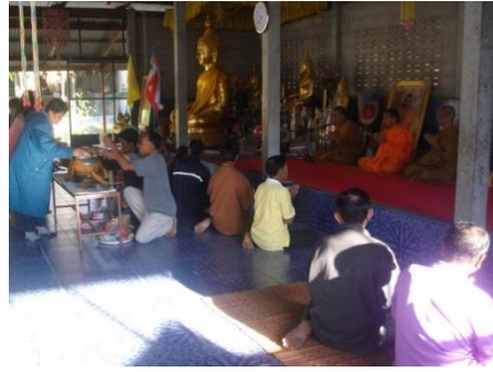
วันออกพรรษา