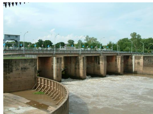
ฝายกั้นน้ำ