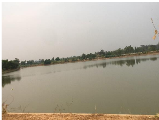
อ่างเก็บน้ำ (บึงพระเจ้า)