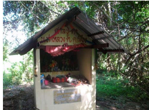
ศาลเจ้าปู่