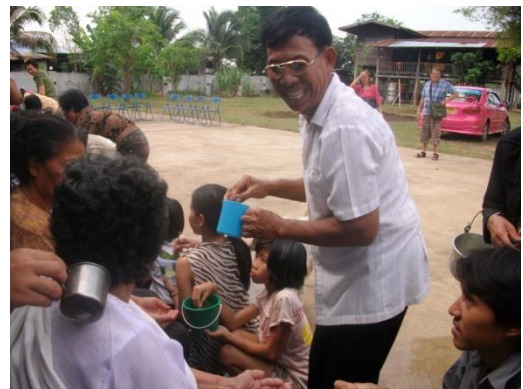
วันสงกรานต์