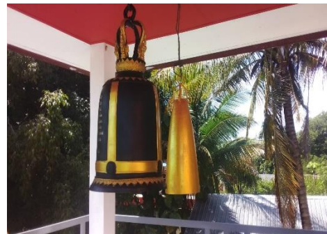
บุญผ้าป่าสามัคคี และถวายระฆัง