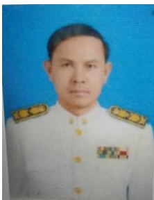
(ส.ต.ท.กฤตพัชญ์ พิมพ์เพ็ง)