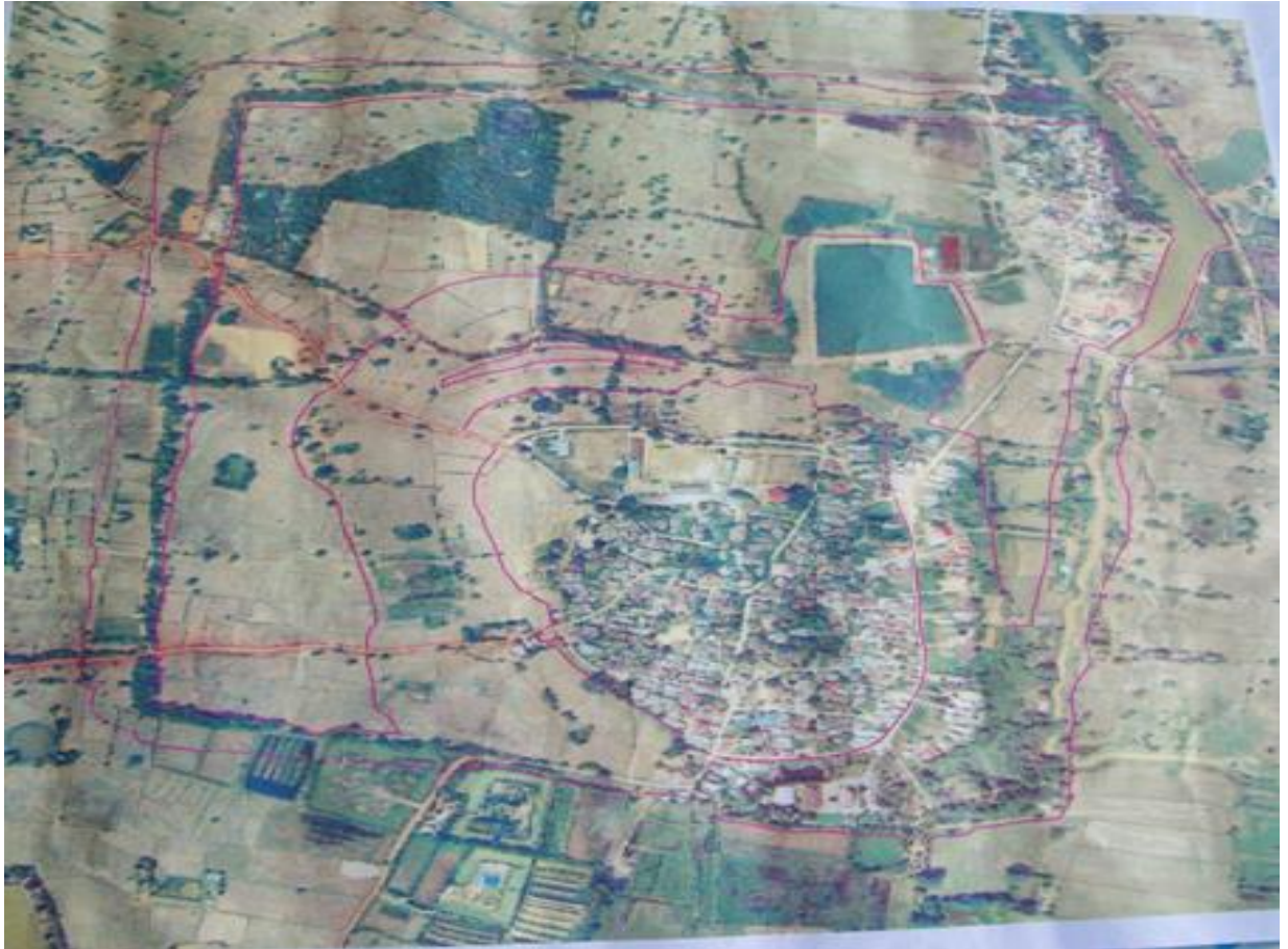
แผนที่รอบหมู่บ้านคูเมืองหมู่ที่ 1-4-6-7