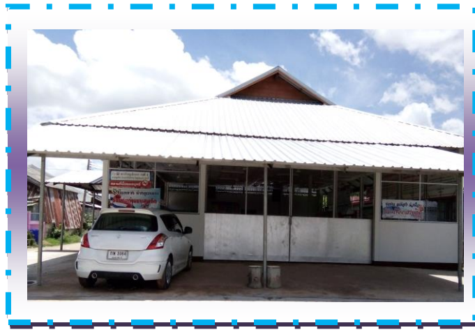
ศาลาประชาคมบ้านคูเมืองหมู่ที่ 4

ก่อสร้างเมื่อ วันที่ 26 กุมภาพันธ์ พ.ศ. 2552-2555 งบประมาณจากประชาชนที่ร่วมบริจาค