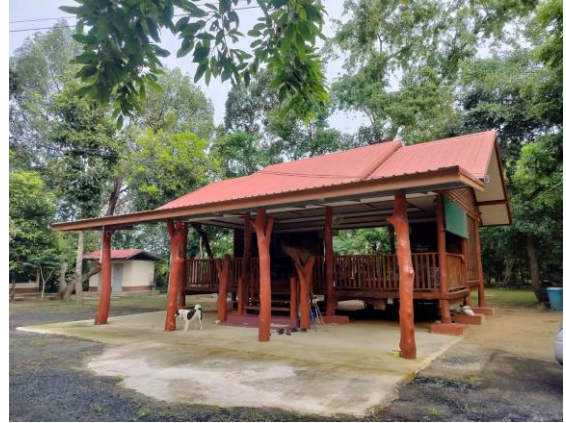
(วัดป่าโพธิ์ธาราม ภาพถ่ายเมื่อ ปี พ.ศ.2567)